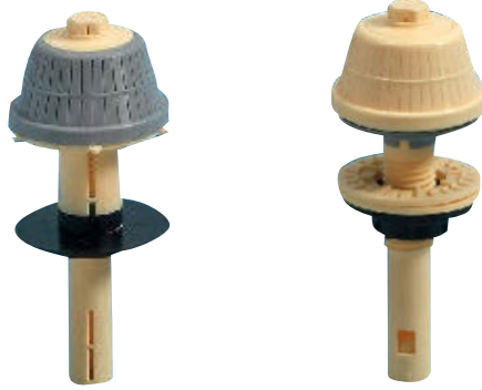
KSP 28/ 36 05