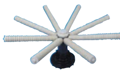
HD 5674 - 1 / HD 5676 - 1