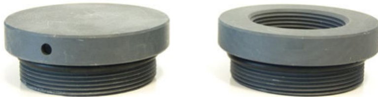
KÖR TAPA VE REDÜKSİYON