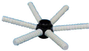
HU 6450 / HU 6600 / HU 6700

HD grubu difüzörlere tank alt bağlantı parçası dahildir.