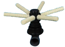
HD 6600 / HD 6700