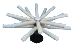
HD 5673 - 2 / HD 5674 - 2 / HD 5676 - 2