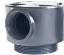
2" MANUEL FİLTRE VALF (İTHAL)