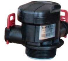
1" YARI OTOMATİK FİLTRE VALF