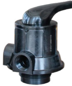
1" YARI OTOMATİK FİLTRE VALF (NSF)