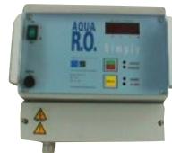
RO SIMP SERİSİ