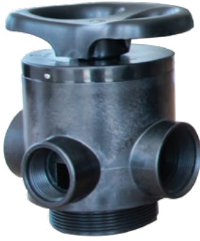
2" YARI OTOMATİK FİLTRE VALF