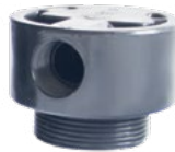
1" MANUEL FİLTRE VALF (İTHAL)