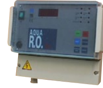
RO EV SERİSİ